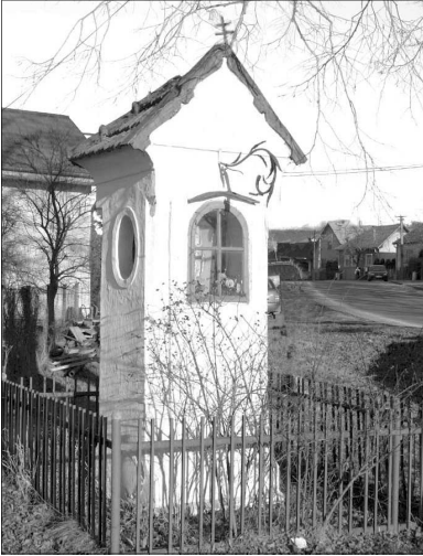
Kaplnka pri vstupe do Necpál.

telom Ukrižovaného Božieho Syna. S problémom začlenenenia do dnešného prostredia sa stretávame i v prípade kríža v blízkosti Carpathie na Košovskej ceste. Bol postavený v roku 1932 na mieste staršieho kríža, v roku 1948 bol však premiestnený bližšie k Handlovke, na miesto vjazdu do brodu. Dnes je síce skrytý za garážami, no kvety a sviečky svedčia o tom, že ľudia si cestu k nemu predsa nájdu.