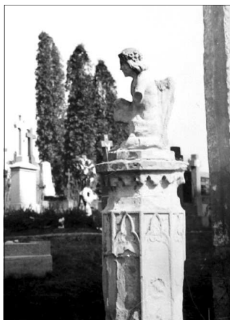
Zaniknutá kamenná socha anjela pred Mariánskym kostolom.

Kalvárie a križové cesty v krajine boli budované predovšetkým v 17. a 18. storočí ako napodobenie Svätého vrchu v Jeruzaleme. Ich celková