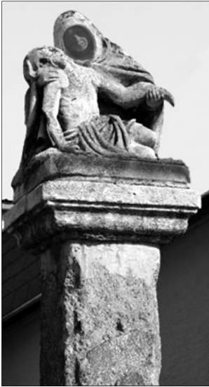
Pieta na Bojnickej ceste.

Z 18. storočia pochádza tiež mariánsky stĺp so sochou Panny Márie Immaculaty umiestnený pred Kláštorom piaristov. Socha Panny Márie pred farským Kostolom sv. Bartolomeja z roku 1693 je najstaršou zachovanou sochou v Prievidzi a patrí i medzi najstaršie barokové mariánske sochy na Slovensku (Rusina, 1983, s. 49, Mazúrová, 1990). Otázka autorstva a datovania týchto dvoch sôch je však stále otvorená.